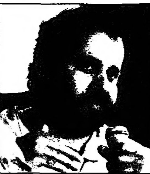
اسامة محمد (القدس العربي)

سيناريو واخراج: نجيل المالح، تمثيل سمر سامي وبسام